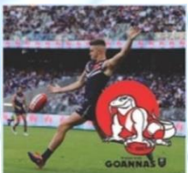
Aussie Rules オージーボール