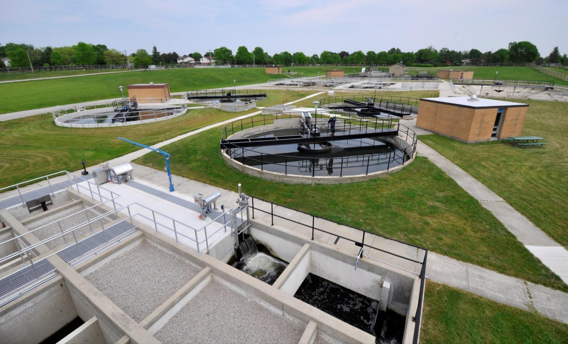
ゴドリッチ上下水道システム(オンタリオ州)