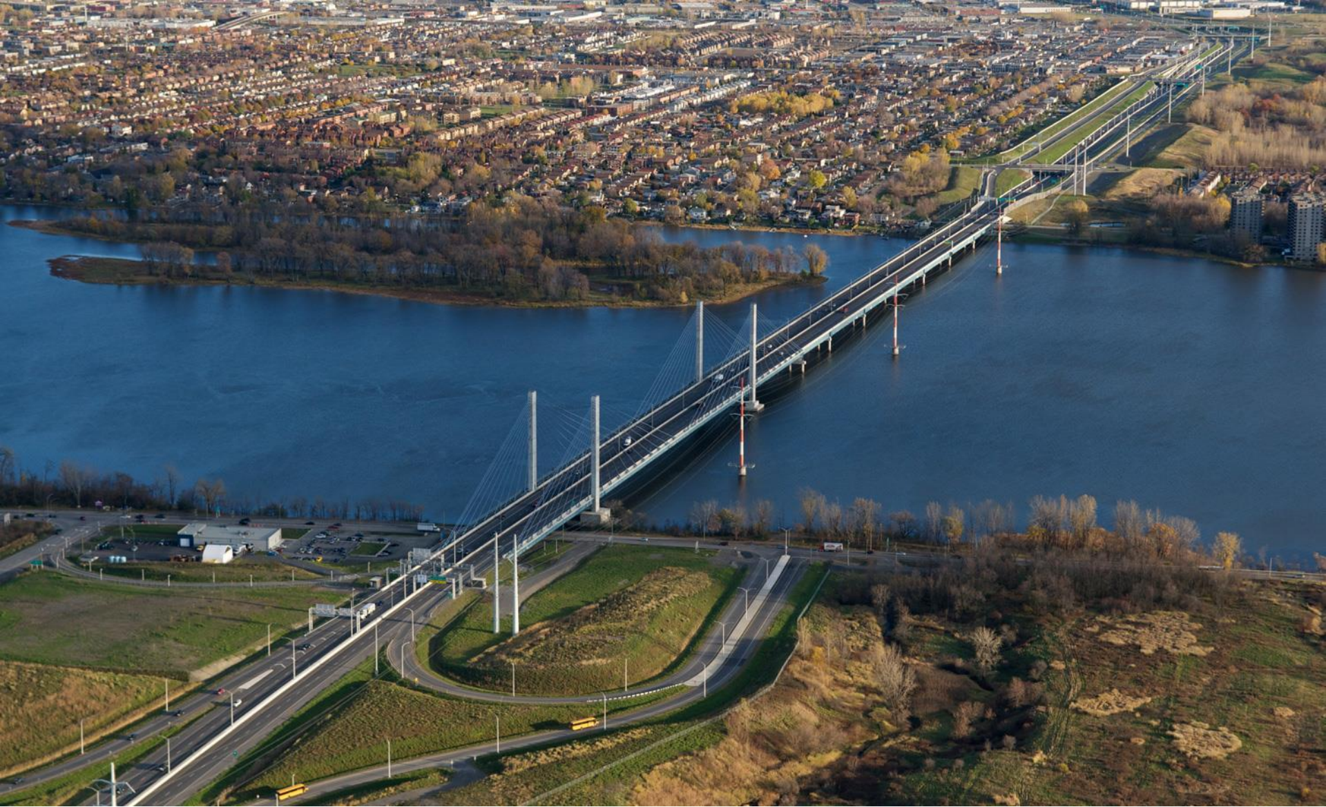
オートルート25号線(ケベック)