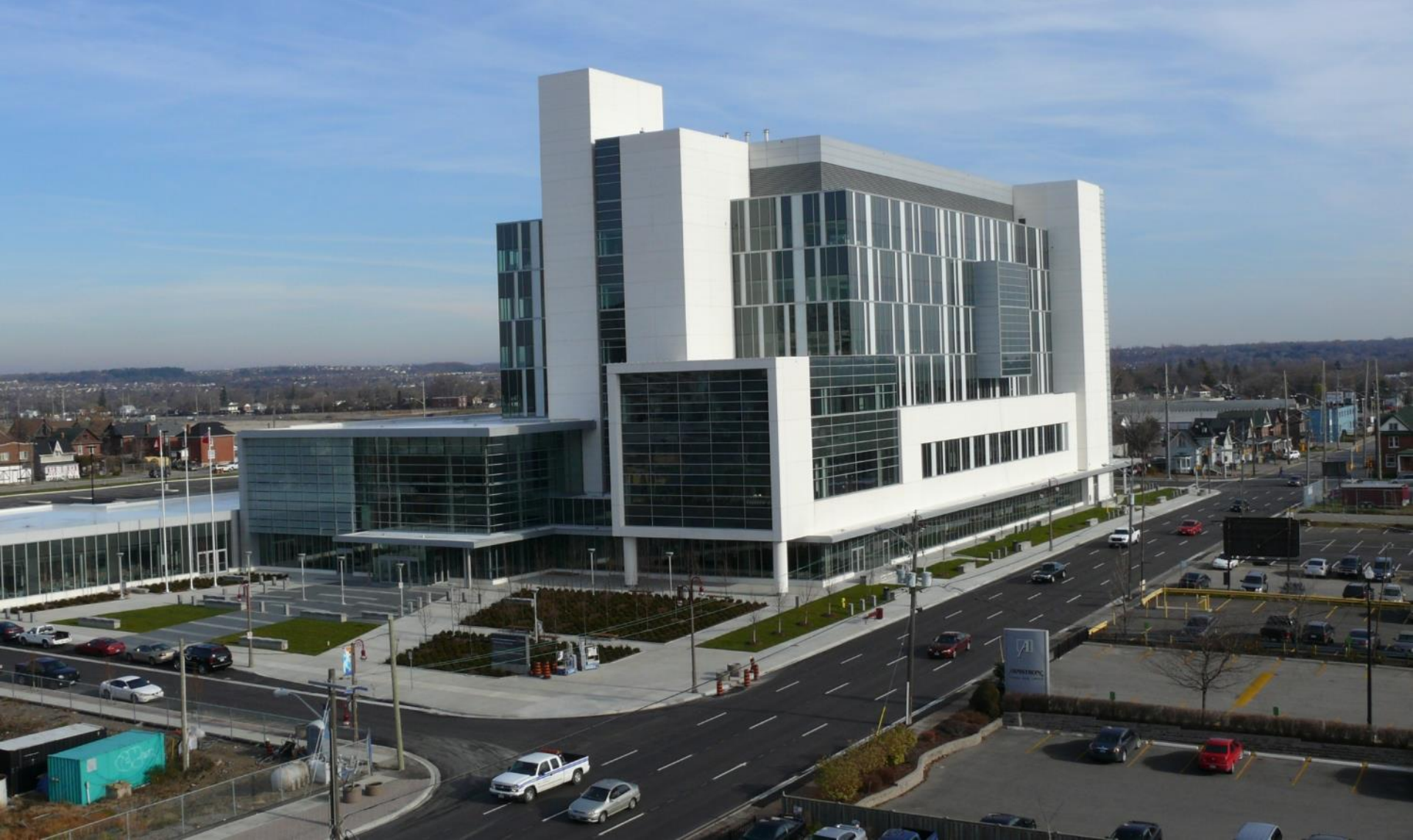
ダラム裁判所(オンタリオ州オシャワ)