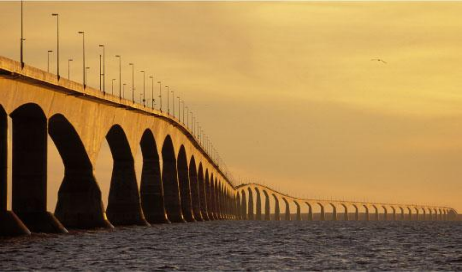
コンフェデレーションブリッジ(ニュー・ブランズウィック州とプリンス・エドワード島を結ぶ)