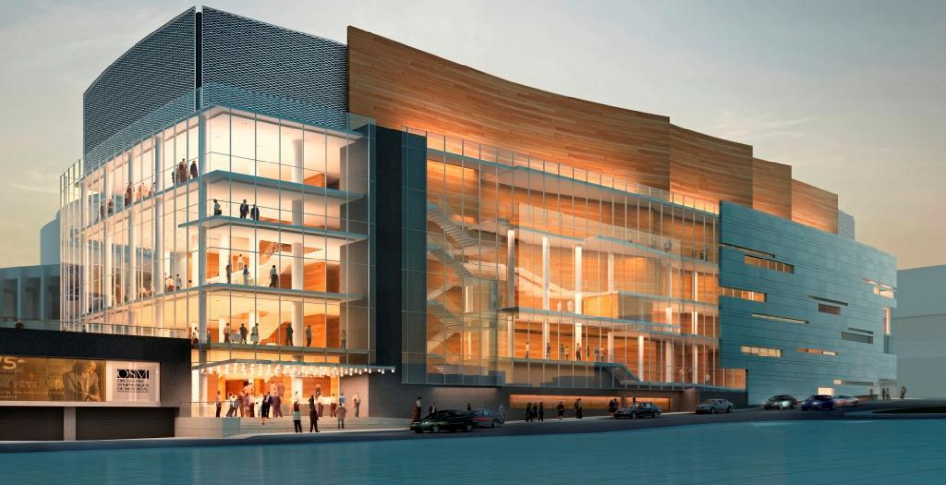
モントリオールのコンサートホール「メゾン・シンフォニック」(ケベック州)