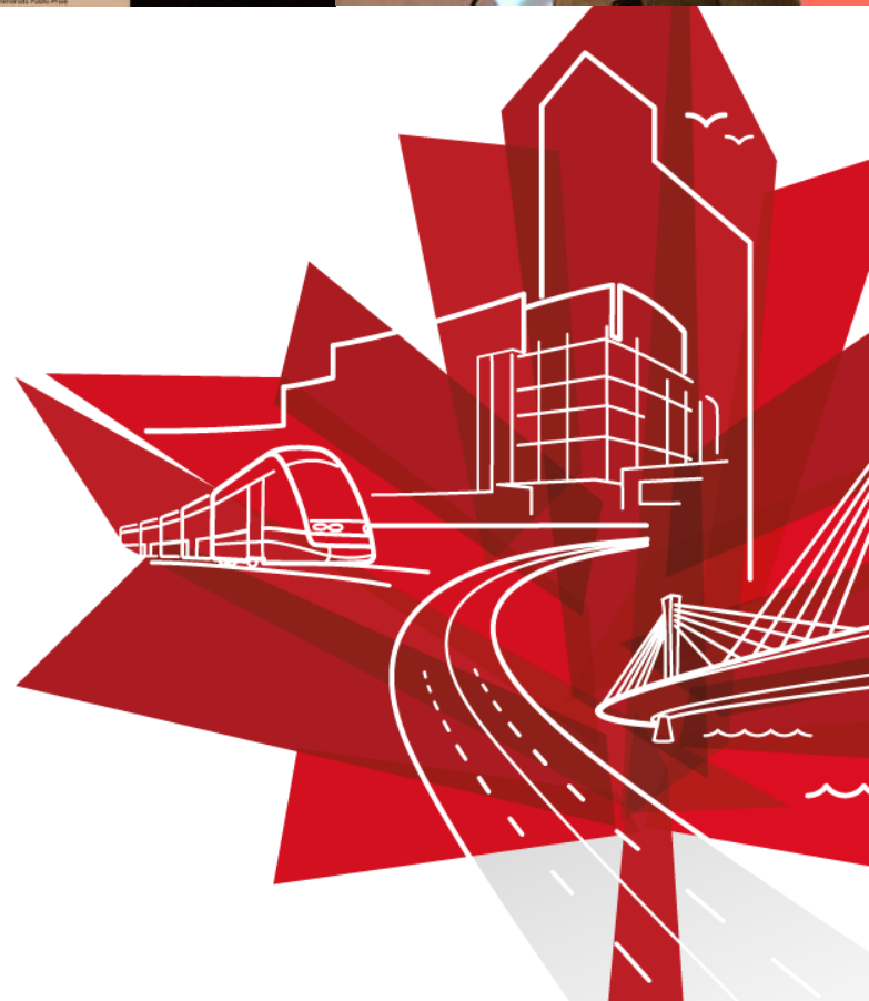
Canadian P3: Building the Global Standard