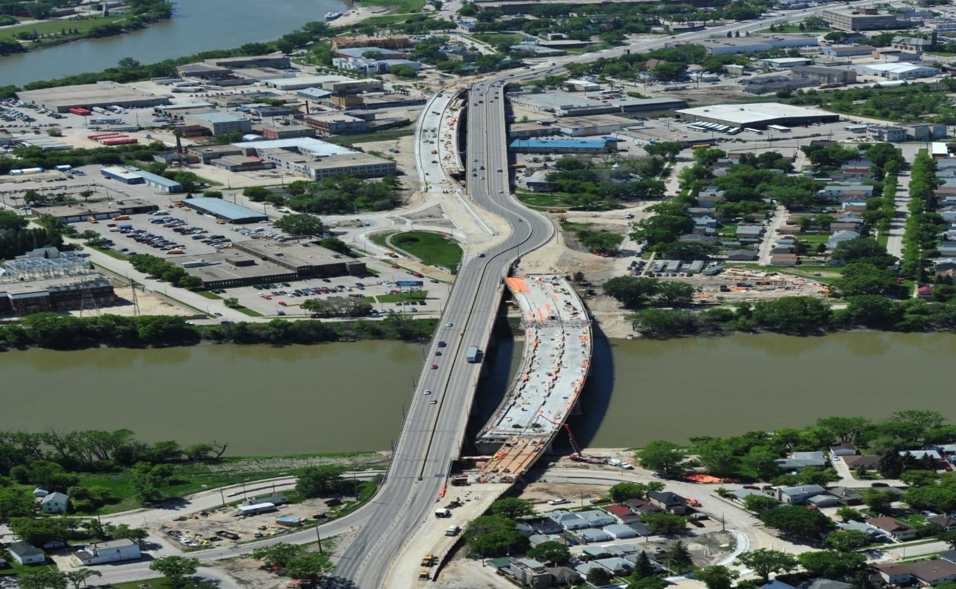
ディズレーリ・ブリッジ(マニトバ州ウィニペグ)