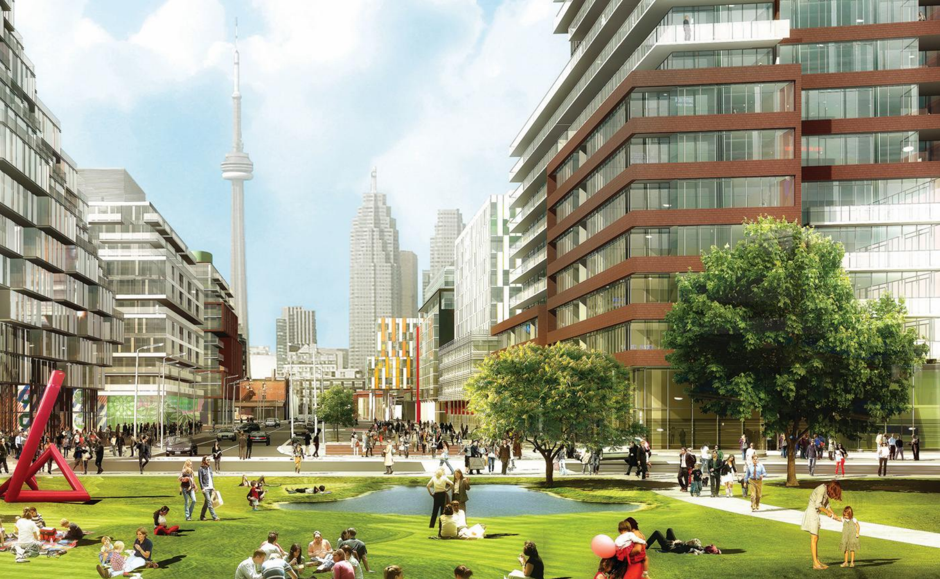
パンナム・アスリートビレッジ(オンタリオ州トロント)