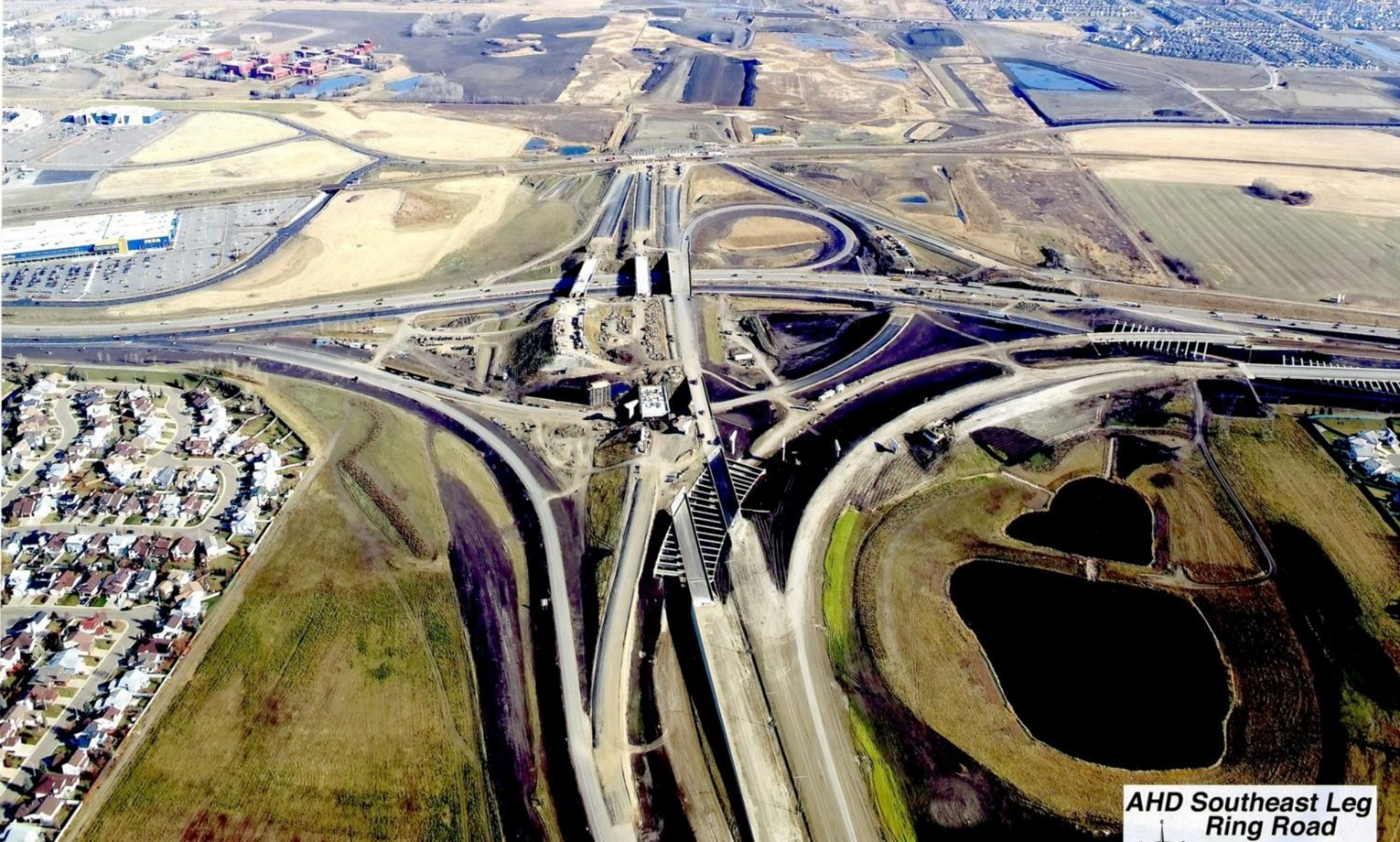
アンソニー・ヘンデイ南東自動車道(アルバータ州エドモントン)