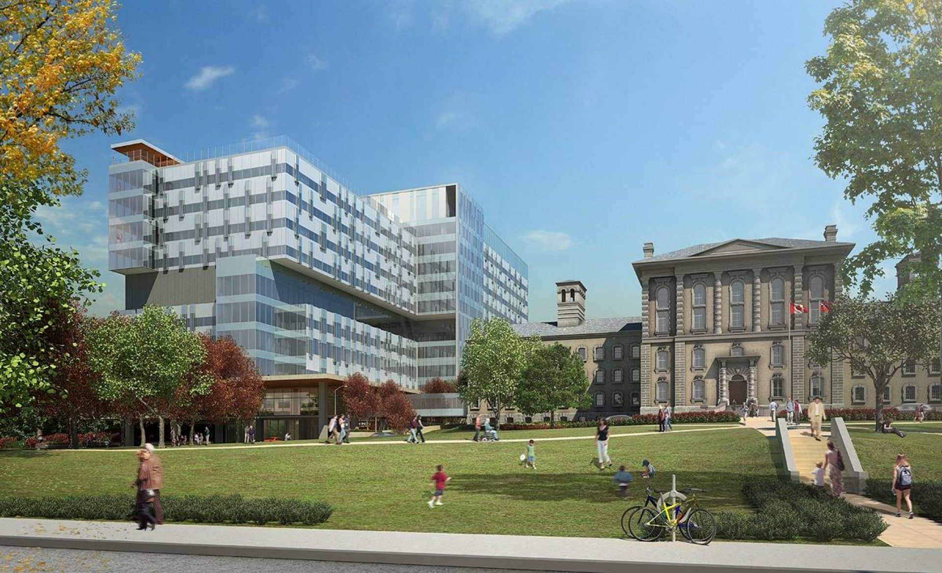
ブリッジポイント・ヘルス(オンタリオ州トロント)