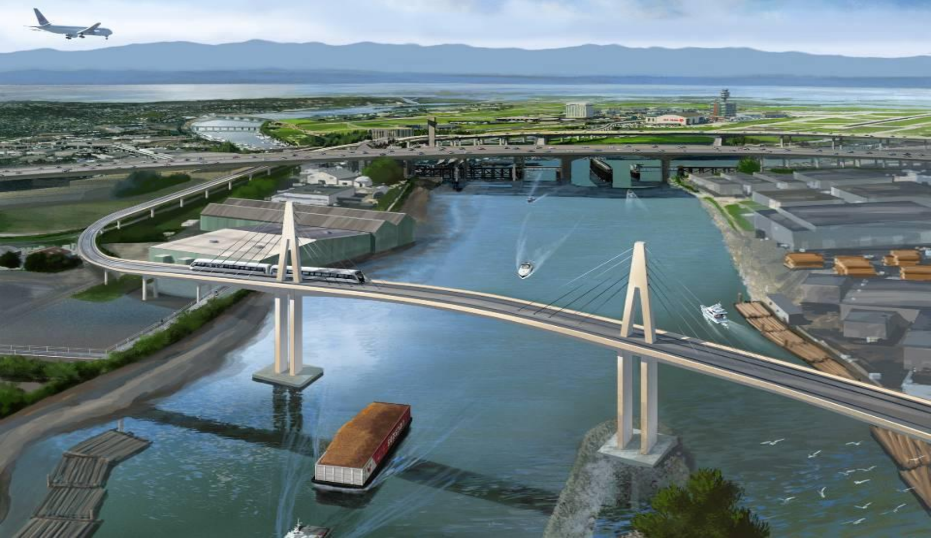
カナダライン(ブリティッシュ・コロンビア州バンクーバー)